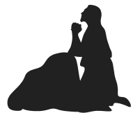
Poema de Cuaresma

EN ESOS PIES HALLÉ PERDÓN Y CIELO, Y NO PUDE SUFRIR VERLOS CLAVADOS, PUES LOS PASOS QUE DIERON POR EL SUELO ¡OH, CUAN ÍNGRATAMENTE SON PAGADOS!" Lope de Vega