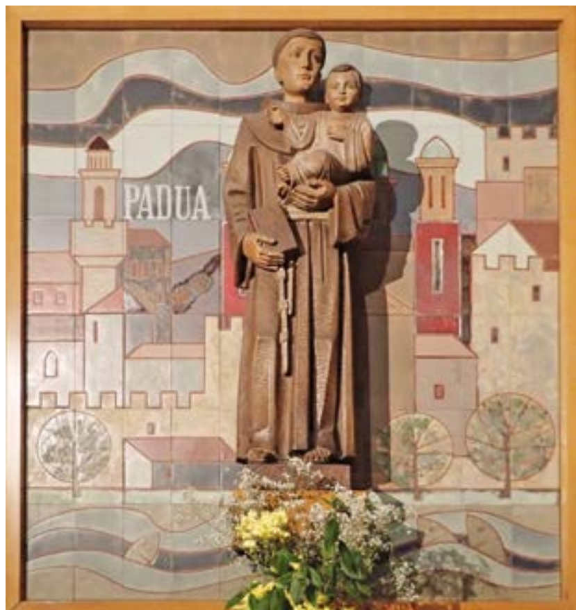
Parròquia de la Mare de Déu de Betlem, altar de sant Antoni de Pàdua (Barcelona)

El proper dijous s'escau la festa de sant Antoni de Pàdua, prevere i doctor de l'Església, una figura vinculada a sant Francesc d'Assís i als primers temps del franciscanisme.