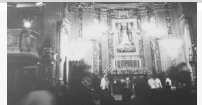
UNA MIRADA AL PASADO: La Basílica después de la Guerra Civil. AÑOS 1950-1960