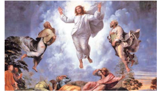
La Transfiguració (1517-1520), de Rafael Sanzio. Pinacoteca Vaticana, Ciutat del Vaticà (Itàlia)