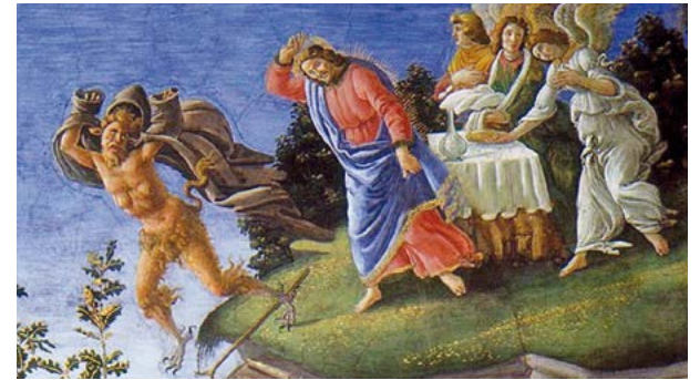
Les temptacions de Crist (1481-1482) de Sandro Botticelli. Capella Sixtina, Ciutat del Vaticà, Roma (Itàlia)